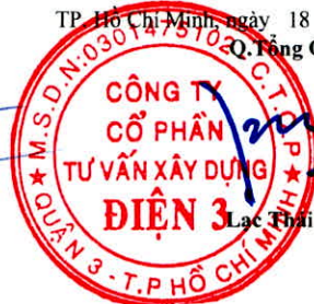
Lạc Thái Phước