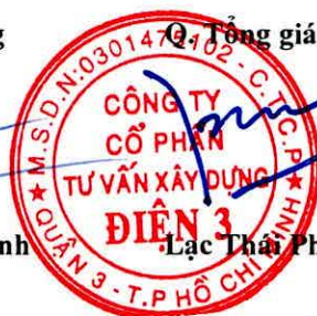
Lạc Thái Phước