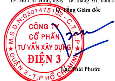
Lạc Thái Phước